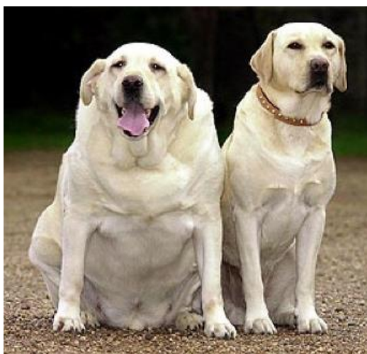
Te dikke vs. normale hond