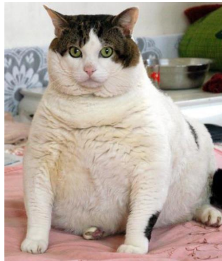
Schattig ??? Nee.

Gelukkig zijn er steeds meer Gemeenten die bezig zijn een soortgelijke regeling van de grond te krijgen. Een belangrijke spil hierin is Stichting Huisdierenwelzijn, waarover wij u ook info geven.